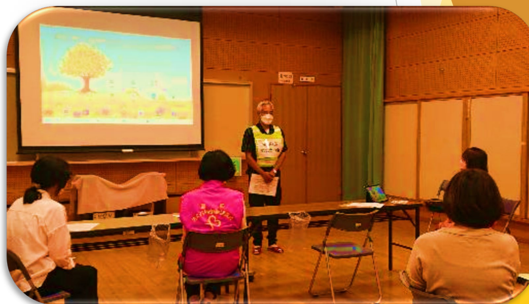
防災士による「災害用伝言ダイヤル」の講話