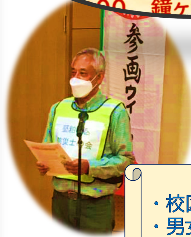
防災士の会会長による「備蓄品の必要性」の講話