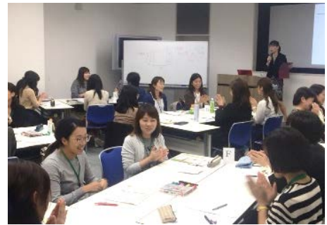
昨年の研修の様子